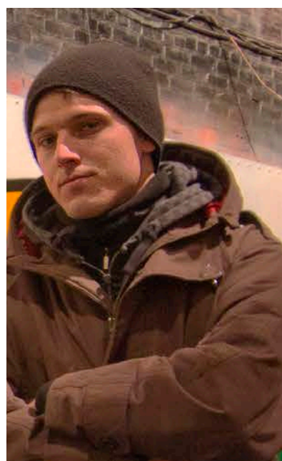
Kenzo144 ©Andrea Pellerani

Dal 2012 vive a Zurigo dove continua a dipingere come pure a svolgere la professione di architetto.