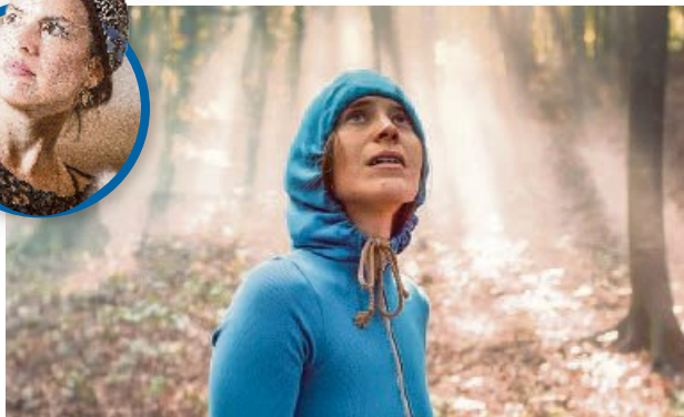
"Love me tender" è una coproduzione Amka e Rsi.

Ha stupito Locarno e poi è partito in giro per i festival del cinema di tutto il mondo. È "Love me tender", della regista di origini peruviane (e ticinese d'adozione) Klaudia Reynicke, che racconta la surreale storia di Seconda, affetta da agorafobia, e la lotta tutta sua per riconquistare il mondo.